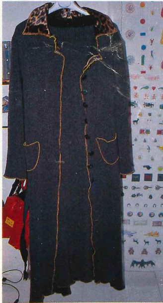
ロングドレス420フラン、コート680フラン。 ポーランドのデザイナー、ポーリナ・ブリツの「マニファクチュラ」より。

パリ取材／Minako Norimatsu (在パリ) ●'98年1月号55頁現在、1(ナンバリング)255頁