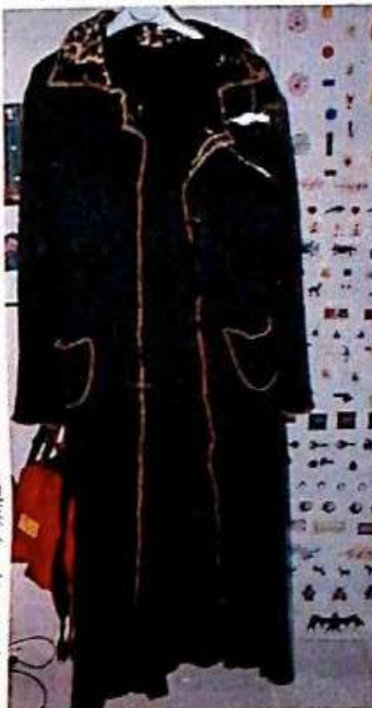
ロングドレス420フラン、コート680フラン。 ポーランドのデザイナー、ポーリナ・ブリツの「マニファクチュラ」より。